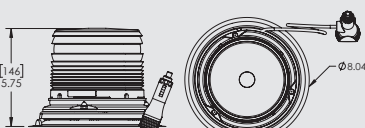
FIXATION SOUS VIDE